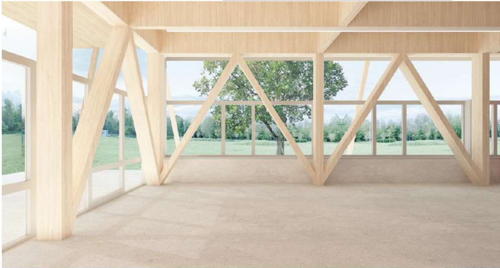
POLO PER L'INFANZIA – aula materna